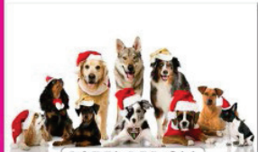
PAZZI PER GLI ANIMALI

Toelettatura completa per il tuo cane al 52% di sconto