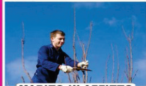
MARITO IN AFFITTO

Tempo di potare: 3 ore di giardinaggio e potatura professionale a